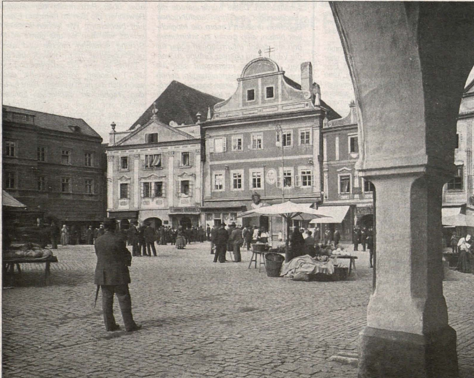
Krummau - Blick auf die Häuser am Markt.